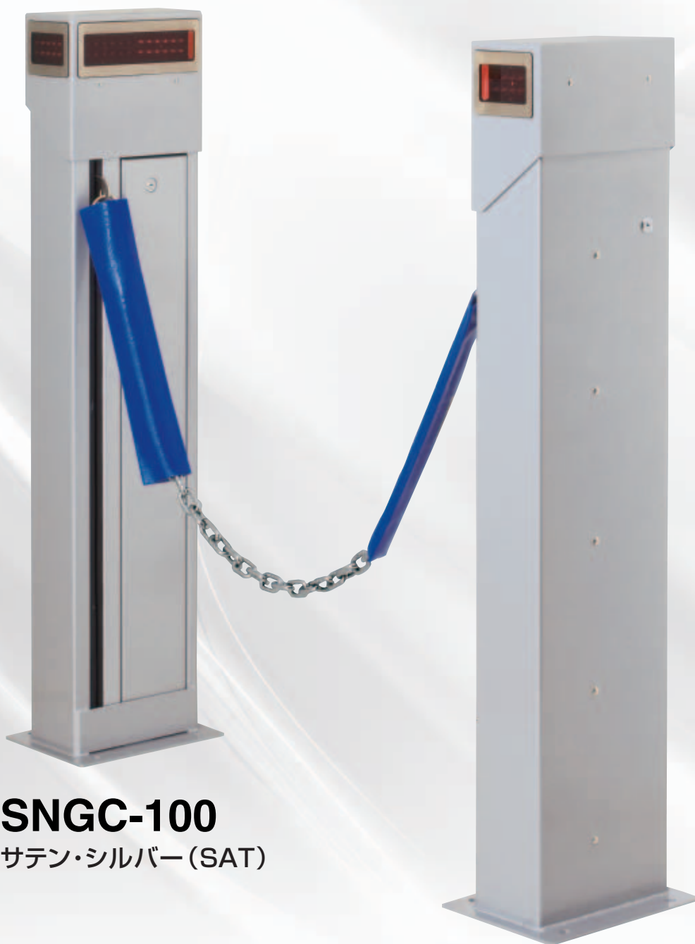
SNGC-100 サテン・シルバー (SAT)